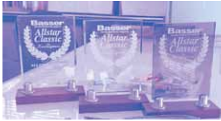
ブラックバス釣りのプロに使用して貰い、大会で獲得したBIG FISHの楯