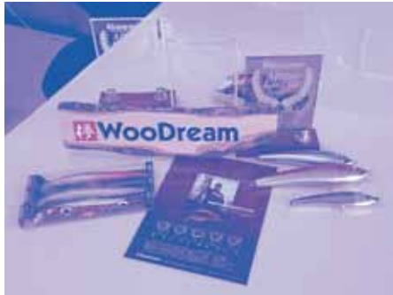
WoodDream 「釣り人と共に“夢を描く”存在に」