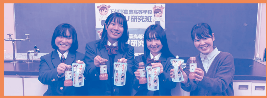
▶アグリ研究班の生徒さんと弊社デザイナー

下伊那農業高校のアグリ研究班様とマルマン(株)様が共同開発した調理みその「味噌だれ漬けガール」とドレッシングの「ドレみそボーイ」のパッケージデザインをお手伝いさせて頂きました。