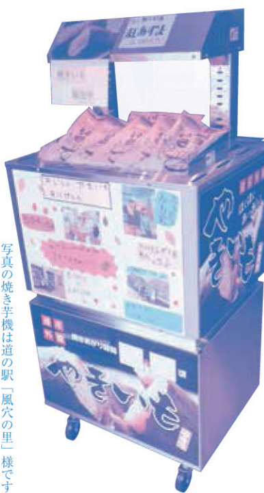
写真の焼き芋機は道の駅「風穴の里」様です