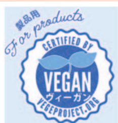
ヴィーガン認証マーク

グルテンフリー認証組織(GFCO)が定める基準を守っている製品で、組織から認証を受けた製品に表示。 認証機関／ Gluten-Free Certification Organization