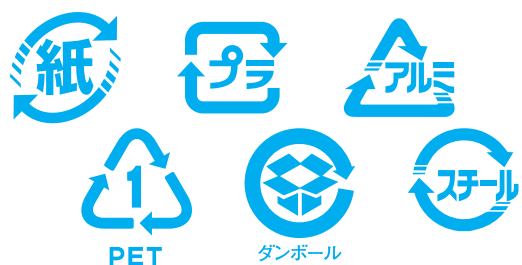
リサイクルマーク