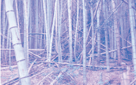
放置された竹林 【間伐材紙のイメージ図】