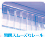
開閉スムーズなレール